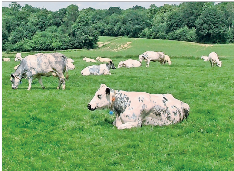
Un des axes du projet est de mieux sélectionner et mieux faire reproduire les animaux répondant aux critères définis pour la race.

Via le soutien du programme Interreg IV et le ministère de la Région wallonne, l'AWÉ asbl renforce son encadrement du rameau Blanc-Bleu belge mixte au travers du projet Bluesel. Ce projet transfrontalier impliquant 7 opérateurs vise à assurer la sauvegarde et la sélection de la race B-BB mixte.